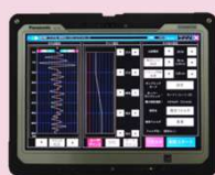
本体部 (タブレットPC)